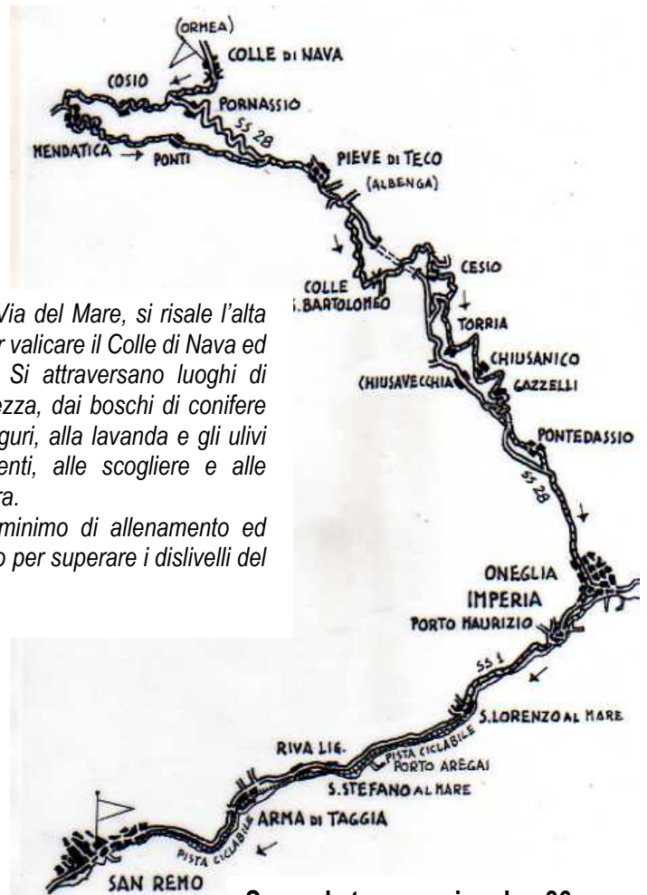
Seconda tappa – circa km 86 e 1.269 metri di dislivello in salita

Ultimo tratto della Via del Mare, si risale l'alta valle del Tanaro per valicare il Colle di Nava ed entrare in Liguria. Si attraversano luoghi di incomparabile bellezza, dai boschi di conifere e faggi delle Alpi liguri, alla lavanda e gli ulivi lungo i terrazzamenti, alle scogliere e alle spiagge della Riviera. E' necessario un minimo di allenamento ed una bici con cambio per superare i dislivelli del percorso.